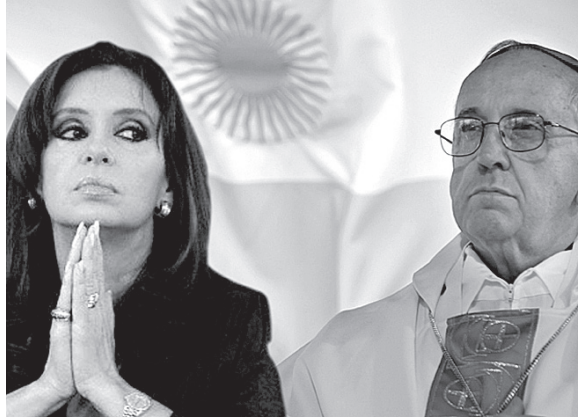
Staatschefin und Gottesdiener

hierbei nicht um einen einfachen politischen Kampf; dies ist die Anmaßung, den Plan Gottes zu zerstören.“ Bereits vorher hatte er sich vehement gegen die Legalisierung der Abtreibung ausgesprochen. Viele Beobachter in Argentinien sind der Meinung, dass Bergoglio seine Überzeugungen nicht verändern wird. Im Gegenteil! Er wird versuchen, nun als Pontifex seine Ziele erweitern und zu erreichen. So zum Beispiel könnte es sein, dass er die katholische Kirche zu einer Plattform gegen die aktuell dominante linke Ausrichtung vieler Regierungen Lateinamerikas formiert. Zugleich kommt es