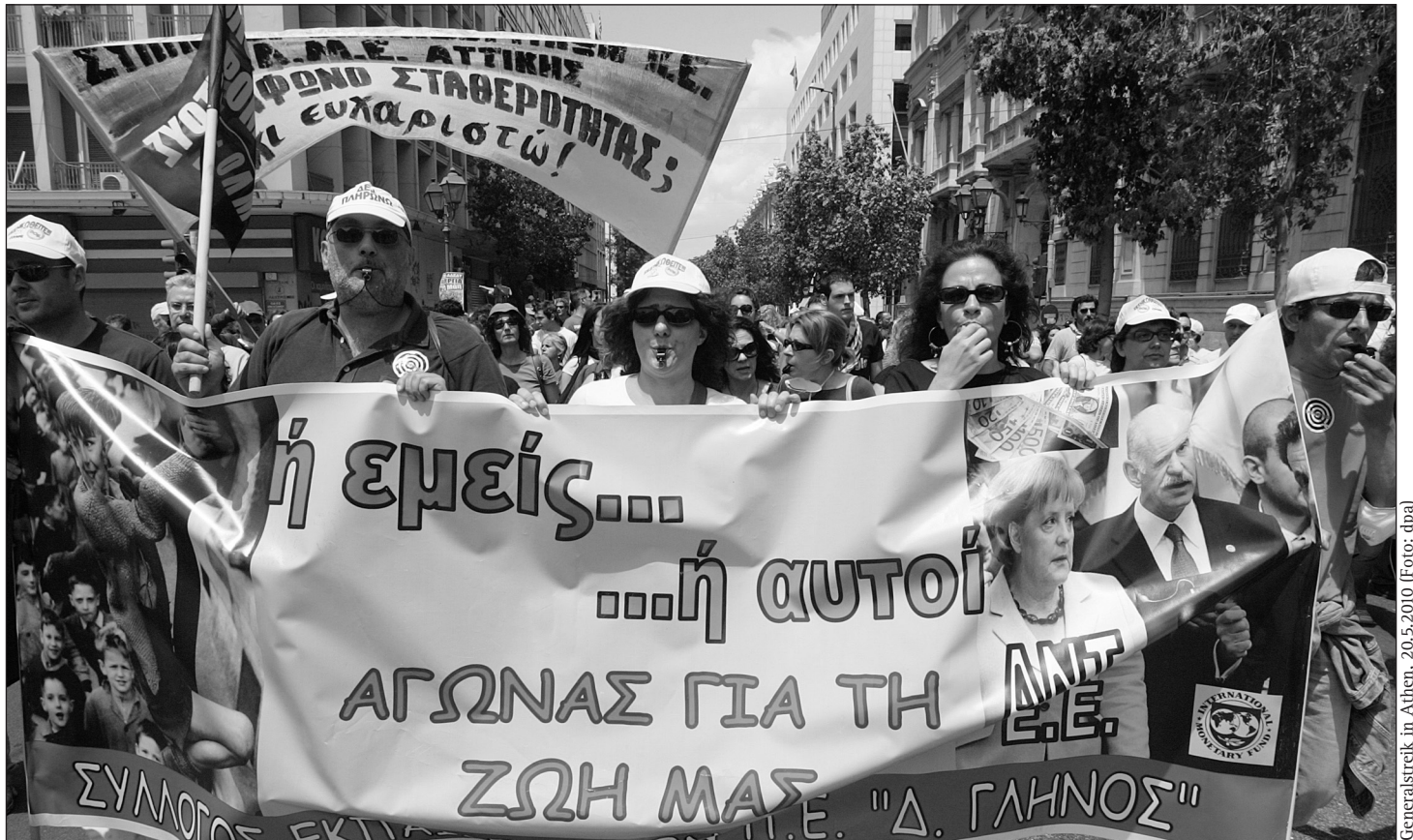
Generalstreik in Athen, 20.5.2010

Der prekäre Zustand der öffentlichen Finanzen ist das dominierende Faktum, das sowohl die ökonomische Lage als auch die politische Situation Griechenlands zurzeit bestimmt und alle anderen Probleme des Landes überlagert. Die Entdeckung des gigantischen Defizits im Haushalt des Jahres 2009 und die Zweifel, ob die griechische Regierung das notwendig gewordene Sparprogramm umsetzen kann, haben dazu geführt, dass Griechenland von den internationalen Finanzmärkten als hoch riskanter Schuldner wahrgenommen wird. Mit dieser Bewertung der Situation rückt für den Fall, dass die Regierung Papandreou nicht rasch sichtbare Sanierungserfolge vorweisen kann, die Möglichkeit eines Staatsbankrotts bedrohlich nah.