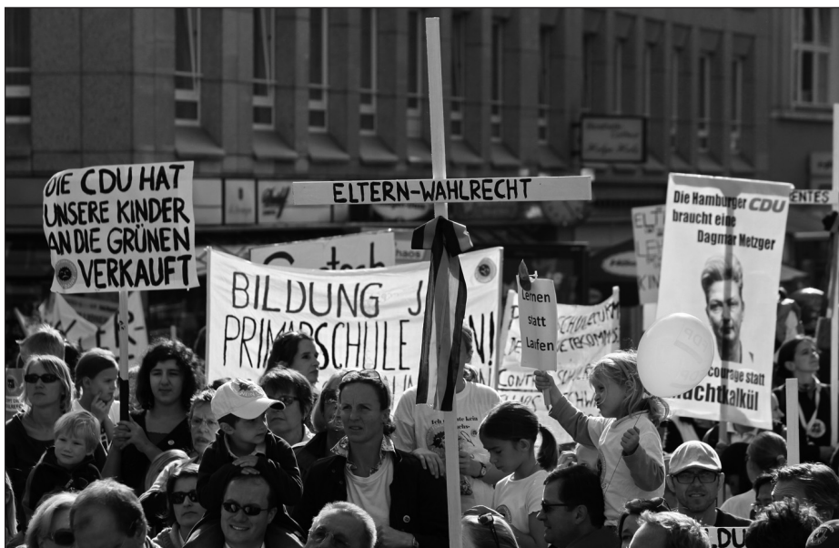
Demo gegen die Schulreform in Hamburg

»Spiel nicht mit den Schmuttelkindern«, zu denen heute in den Augen vieler Kinder aus einkommensschwachen Familien, Hartz IV-EmpfängerInnen und MigrantInnenkinder gehören, ist das Credo von Teilen der Elternschaft. Die Angst ist groß, dass die Heterogenität in den Schulklassen zu Leistungseinbußen führt. Zwangsweise dazu verurteilt zu sein, mit Kindern aus Unterschichten oder ausländischen Kindern gemeinsam in einer Klasse lernen zu müssen, mit Kindern, die der deutschen Sprache nicht mächtig sind und so das Lernniveau der gesamten Lerngruppe drücken und das Lerntempo reduzieren,